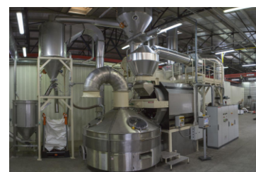
Il nuovo tostatore XtracheneXTRACHÈNE

La prestazione del nostro nuovo tostatore ci ha consentito di pilotare con grande maestria le varie tape della tostatura e di ottimizzare la sintesi di certi aromi ricercati.