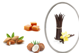
Illustrazione dell'effetto specchio

Nostro approccio della vaniglia è diformato dalle nostre esperienze culinarie dove le tipologie di vaniglia sono numerose ed associate ad altri aromi. La percezione del carattere vanigliato è frutto dell' effetto specchio e di altre sinergie aromatiche che svelano il carattere dolce quanto la vaniglia.